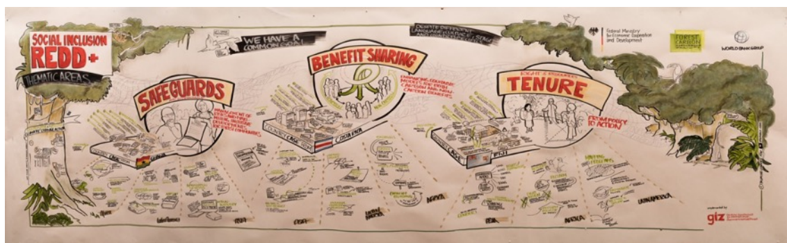
2 Documentación Gráfica I – Yasmine Cordes, bikablo; foto: GIZ/Jonathan Deis